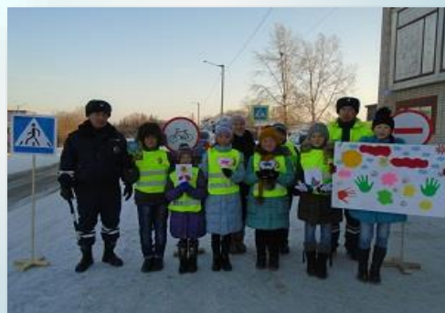
Зайцева Алена, Министр здравоохранения

«ШИК» Школьный информационный калейдоскоп.