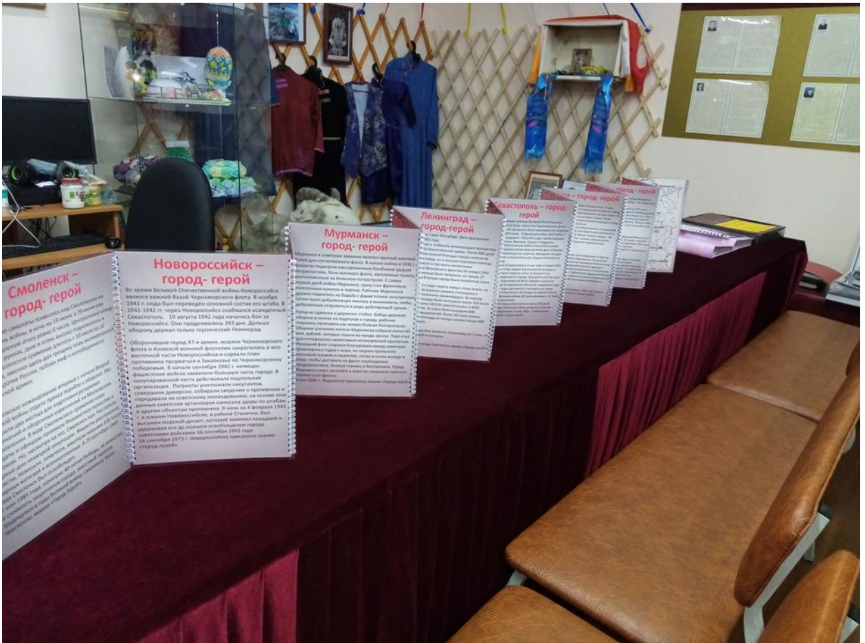
«Уголок боевой славы» после реставрации