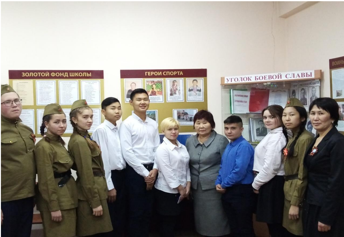
Работа с архивом