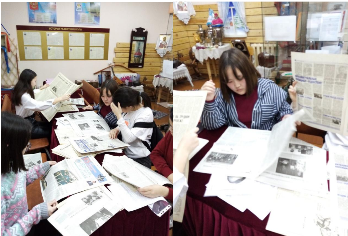
Республиканский семинар г.Улан-Удэ «Памяти Героев»