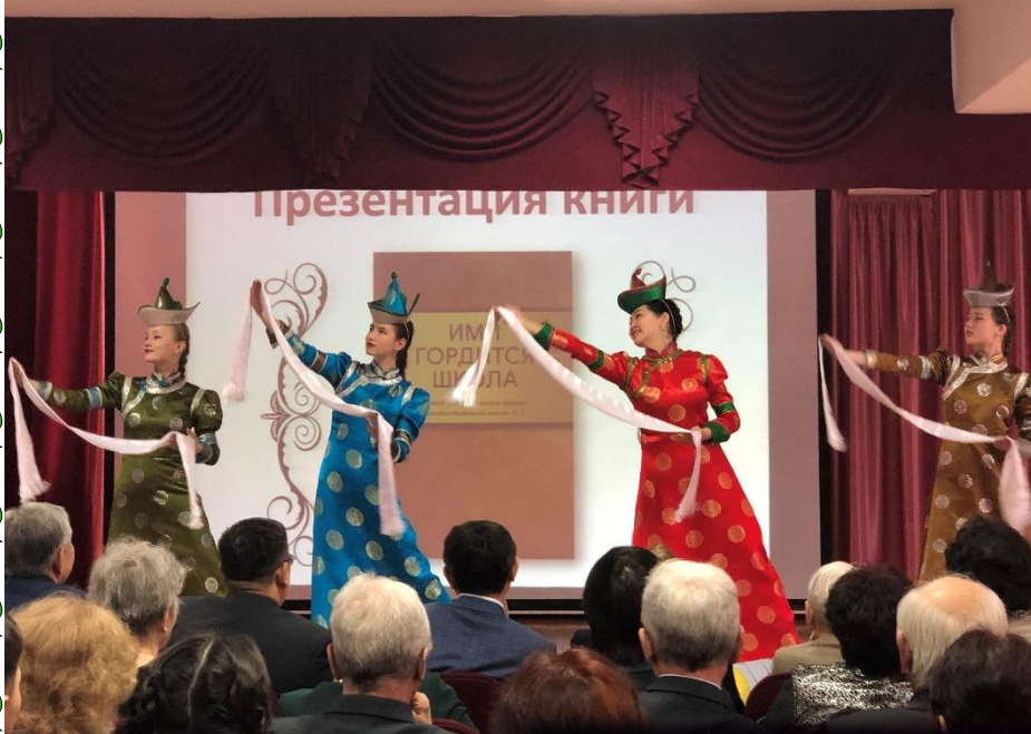
Выступление на презентации книги «Ими гордится школа» Приветственный танец