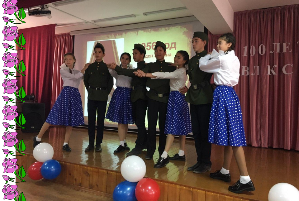
«100 лет ВЛКСМ» - участие в школьном мероприятии