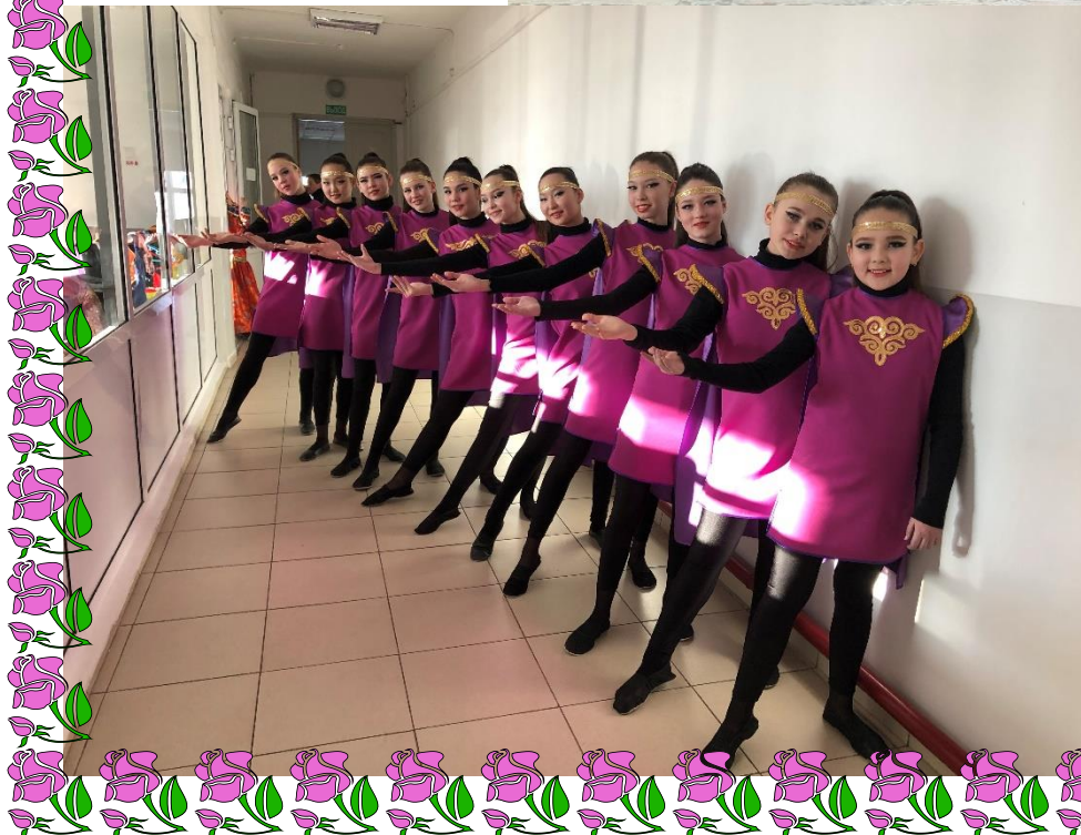
Эстрадный танец «Залуушул»