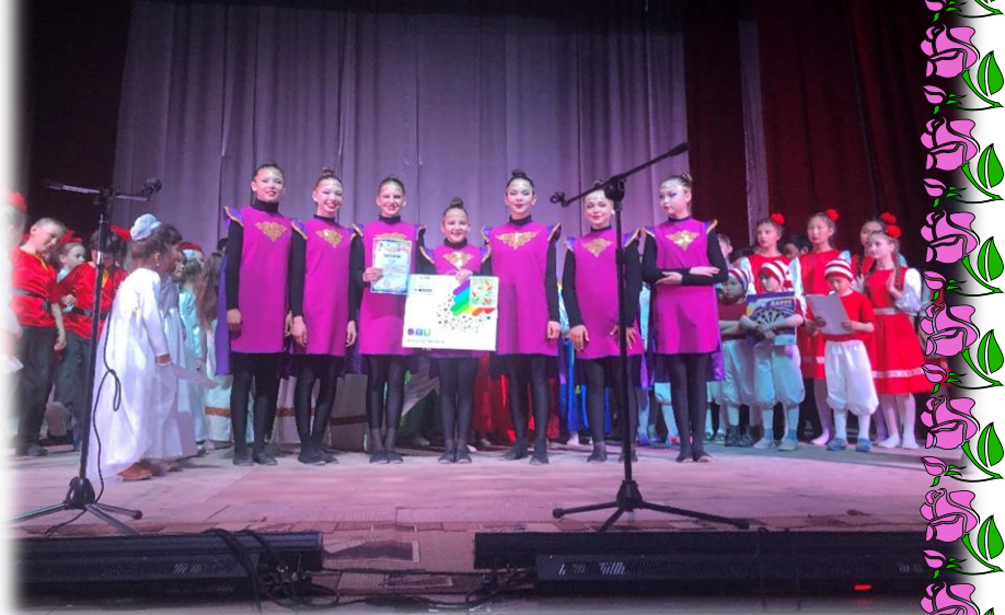
I место в районном конкурсе юных дарований «Бэлигэй толон»