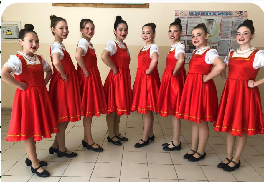
Русский народный танец «Частушка». Выступление на празднике Последнего звонка.