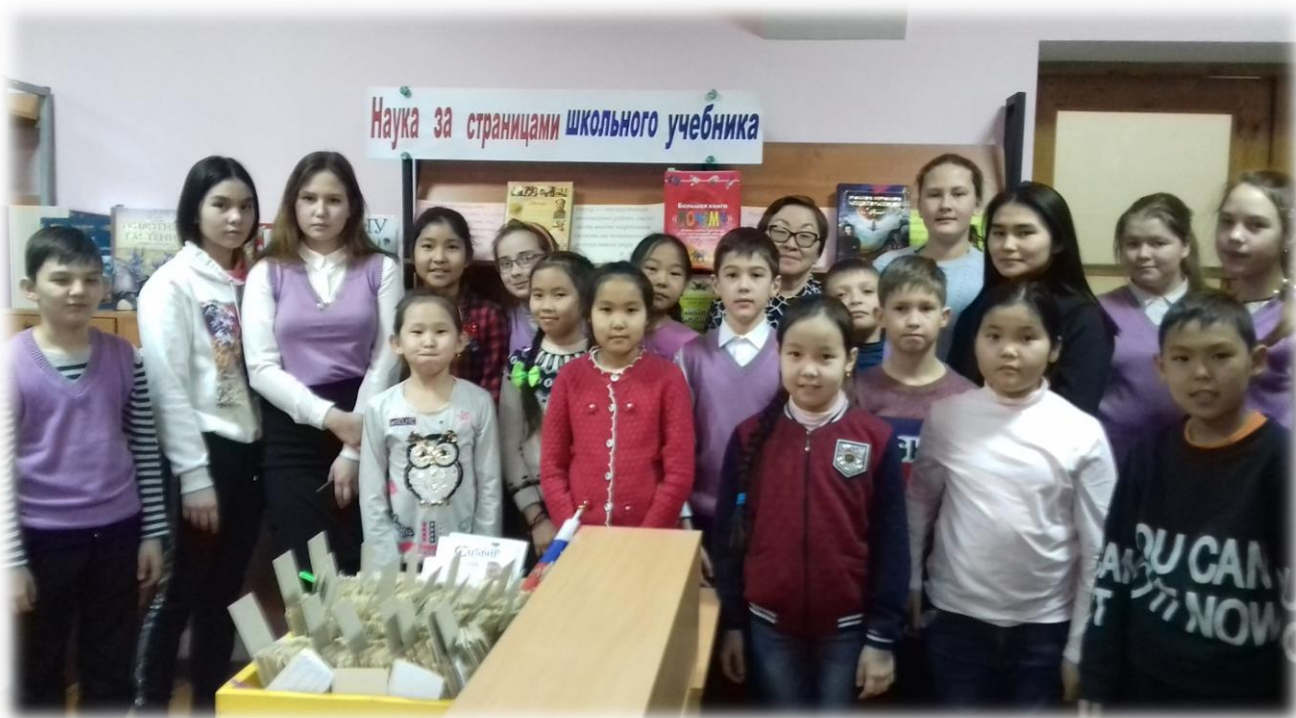
«Наука за страницами школьного учебника» ( занятие в школьной библиотеке)