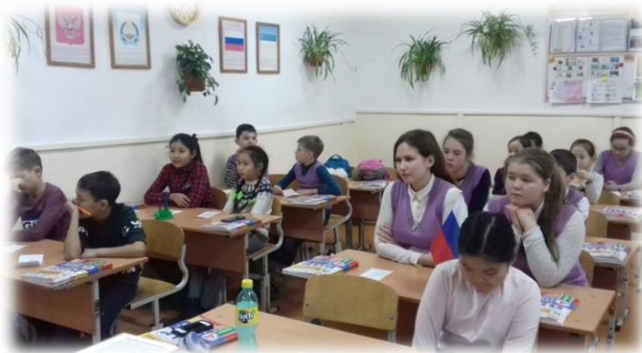
На заседания НОУ