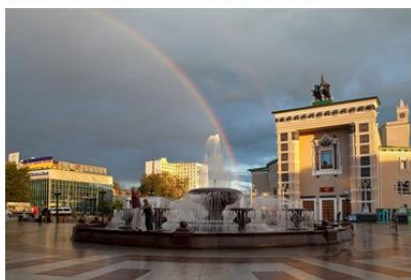
Мой родной город- Улан-Удэ.