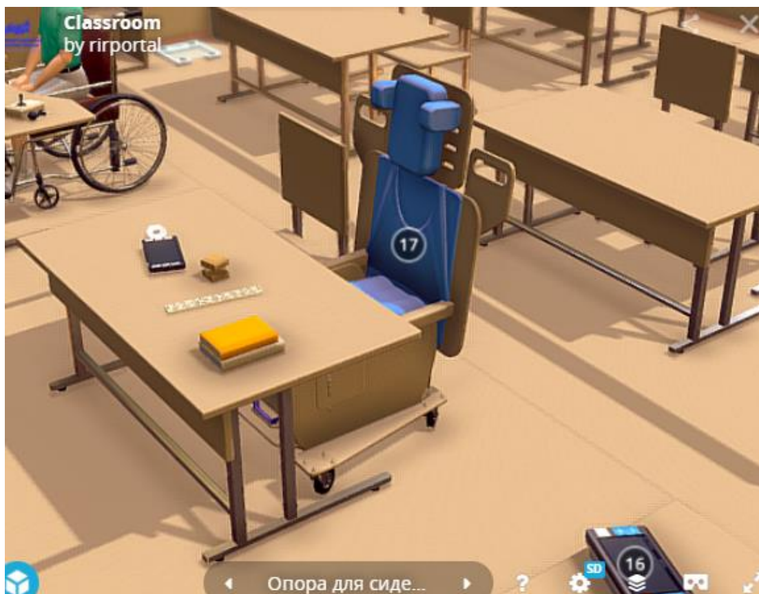
Рис.3. Модельное решение (ученический стол)