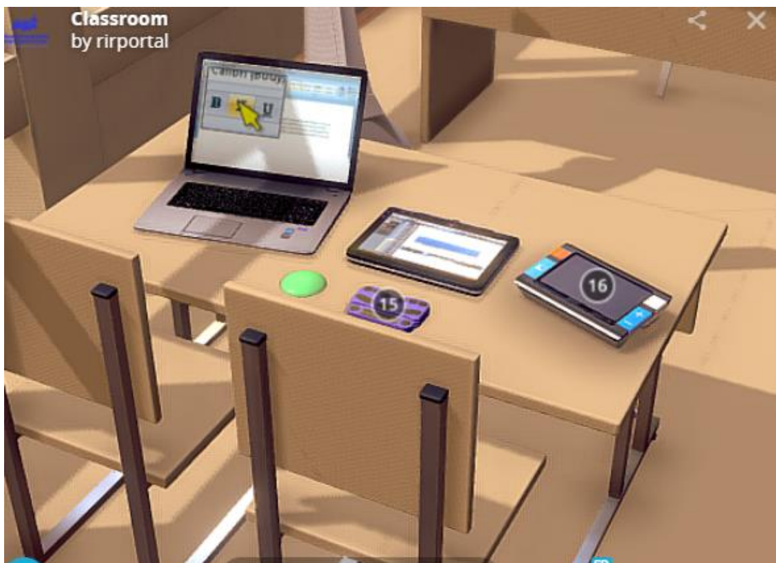
Рис.5. Модельное решение (адаптированная компьютерная техника)