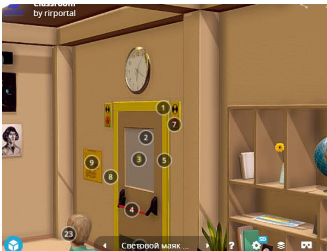
Рис.6. Модельное решение (входная группа)