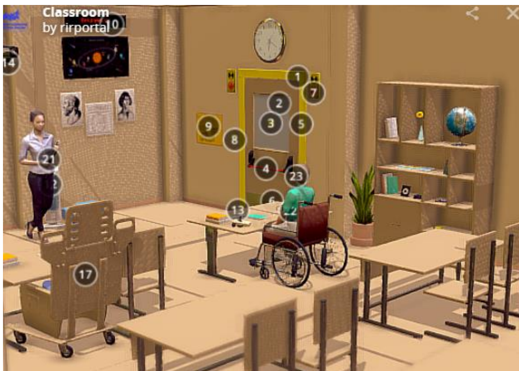
Рис.2. Модельное решение (общий вид)