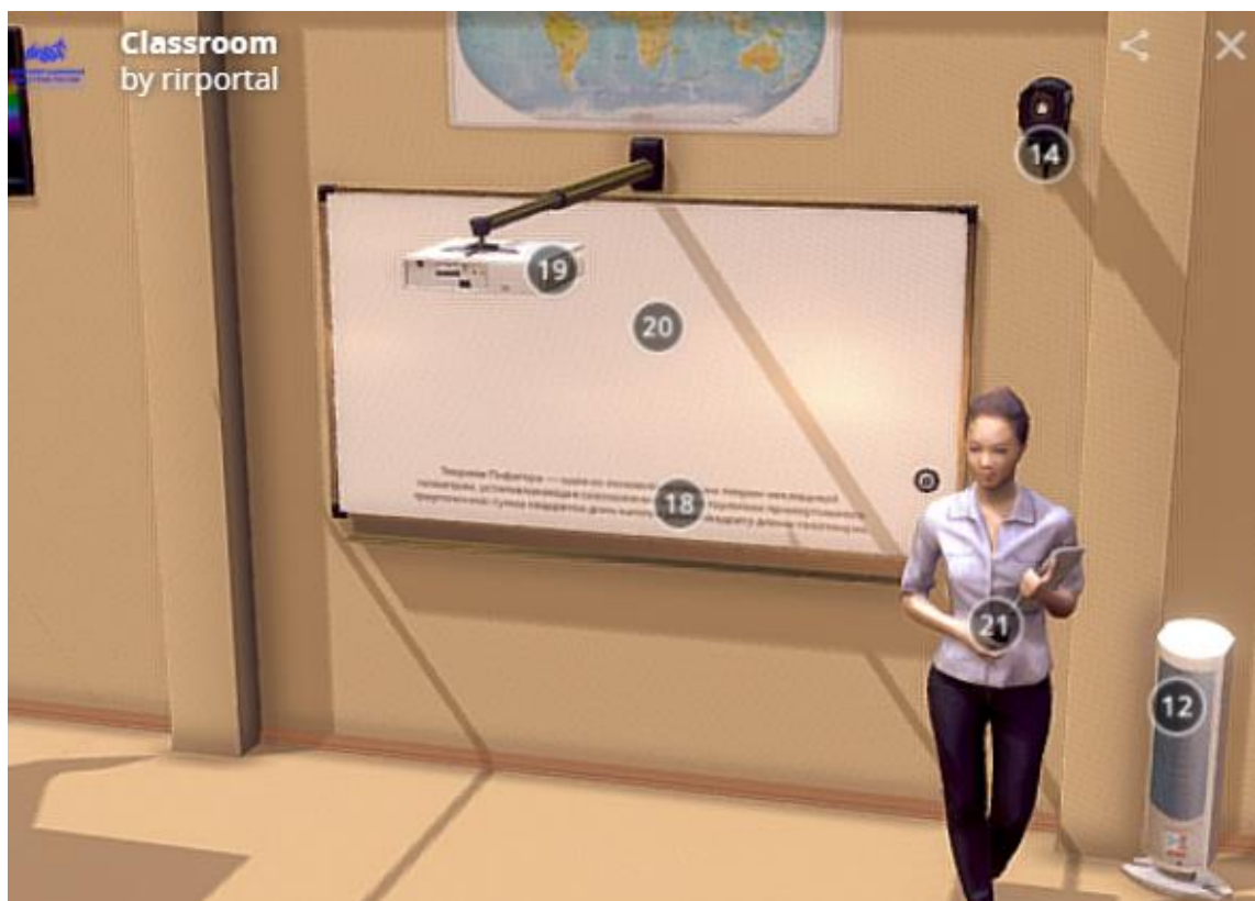
Рис.7. Модельное решение (проектор с интерактивной доской)