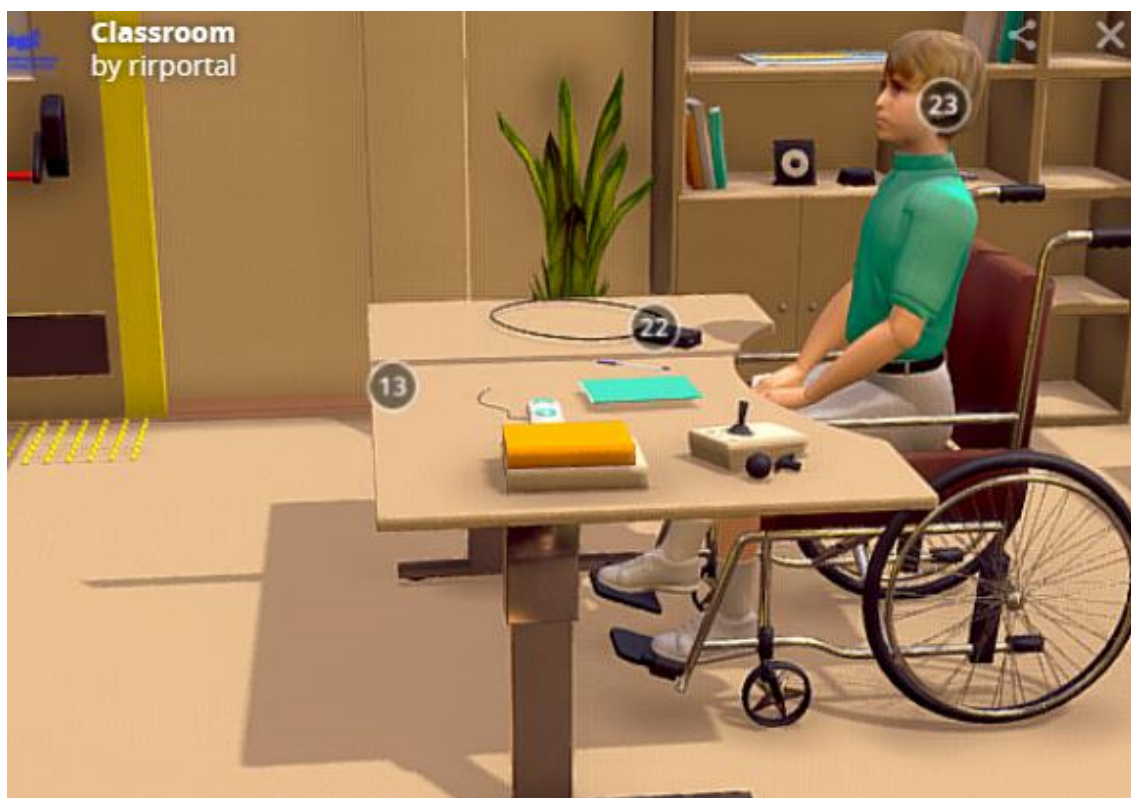
Рис.4. Модельное решение (ученический стол)